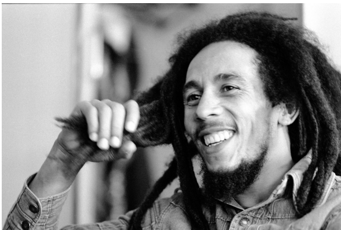
Bob Marley (1945 - 1981) indossa i dreadlocks. All'interno della religione Rastafari i dreadlocks simboleggiano un voto (nazireato) che i fedeli possono compiere. I dreadlocks sono dunque un segno religioso, non una semplice acconciatura.

Con gli anni 80 entrarono a far parte della discussione sulla bellezza al naturale anche i capelli acconciati in dreadlocks delle persone Nere, specialmente proseliti della religione Rastafari, fra cui il più noto Bob Marley. Quando durante un'intervista al cantante (reperibile nel documentario Marley ), un giornalista bianco gli chiese quale fosse il suo rapporto con i propri capelli, e perché non li tagliasse mai, la concisa risposta di Marley fu « hair is my identity »: i capelli sono la mia identità.