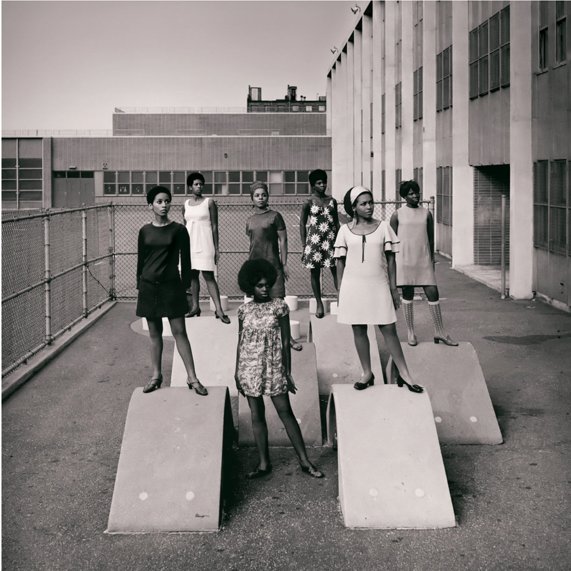
Servizio fotografico in una scuola per uno dei molti gruppi di modelle che avevano iniziato ad abbracciare le acconciature naturali, 1966

Un'altra persona attraverso cui la lotta per la liberazione dall'oppressione bianca passò anche attraverso i capelli è la celebre attivista Angela Davis. Davis portava (e porta tutt'oggi) orgogliosamente i capelli ricci Afro al naturale, diffondendo così il messaggio che divenne uno degli slogan delle Black Panther: "Black is beautiful".