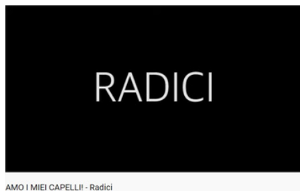
AMO I MIEI CAPELLI! - Radici

In Radici viene discusso il rapporto con i propri ricci afro, il significato di portare questi capelli da bambine - influenzate dallo standard di bellezza occidentale del capello liscio - e del taglio come simbolo di rinascita e di ricostruzione della propria identità.