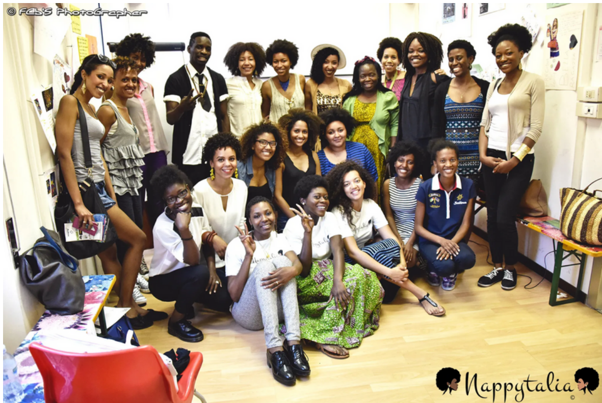
La community di Nappy Italia , Roma, 2015

Questo perché, nonostante le differenze tra contesto e contesto, come tra Stati Uniti ed Italia, vi sono anche molti elementi comuni nei processi di razzializzazione che le persone Nere vivono nel mondo bianco.