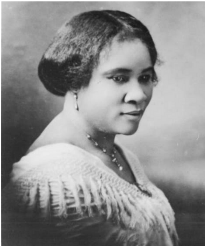
Madame C.J. Walker sulla sinistra, sulla destra manifesto pubblicitario dei prodotti di C.J. Walker

Fra le persone impegnate nella diffusione di prodotti che rendessero i capelli meno ricci divenne famosa Madame C. J. Walker. L'imprenditrice, grazie alla vendita dei suoi prodotti chimici liscianti che rendevano i capelli ricci afro simili a quelli delle persone bianche, divenne la prima donna milionaria Nera grazie alla vendita del suo prodotto.