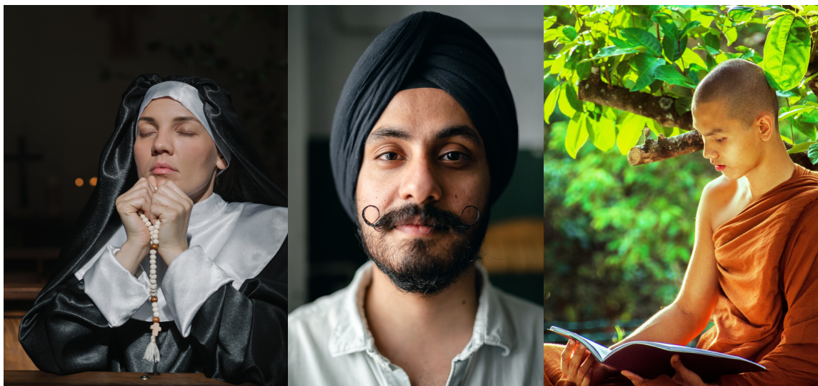
Da sinistra: una suora cattolica, un uomo Sikh, un monaco buddhista

I capelli hanno da sempre costituito un ruolo fondamentale nella presentazione dell'immagine di sé. I capelli racchiudono e veicolano diversi significati a seconda della cultura e della provenienza della persona che li porta, anche quando si decide di non mostrarli affatto, come accade in alcune religioni e culture.