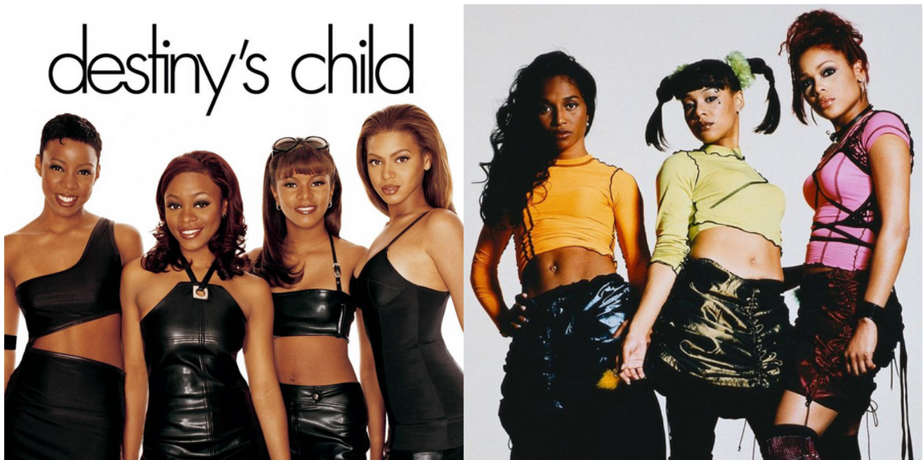
A sinistra la copertina di un LP delle Destiny's child, a destra il trio delle TLC. Entambe le formazioni hanno avuto grande successo nella seconda metà degli anni '90.

Ancora negli anni '90 era infatti di uso corrente la parola “nappy” ad indicare un capello crespo, disordinato e non desiderabile. Nappy significa letteralmente “batuffolo di cotone”, e il termine veniva utilizzato per rimarcare il legame tra nerezza e schiavitù.