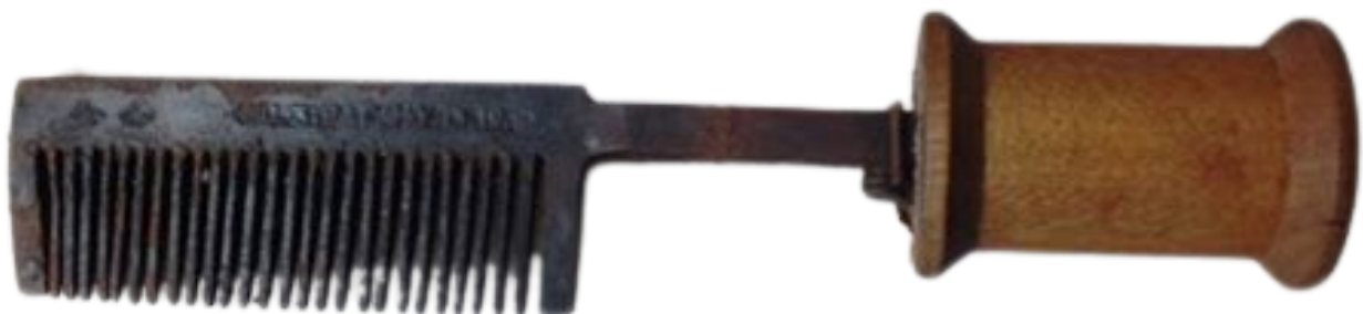
Un "iron hot comb", il pettine scaldato sul fuoco che si utilizzava per lisciare i capelli

In tale contesto, mossi dal desiderio di far assomigliare i propri capelli quanto più possibile a quelli degli schiavisti bianchi, tra le persone nere cominciarono a diffondersi diversi strumenti, tecniche e prodotti per raggiungere questo scopo, come il pettine scaldato sul fuoco, oppure l’utilizzo di agenti chimici utilizzati per la pulizia per renderli meno ricci, spesso a scapito della salute propria e del capello.