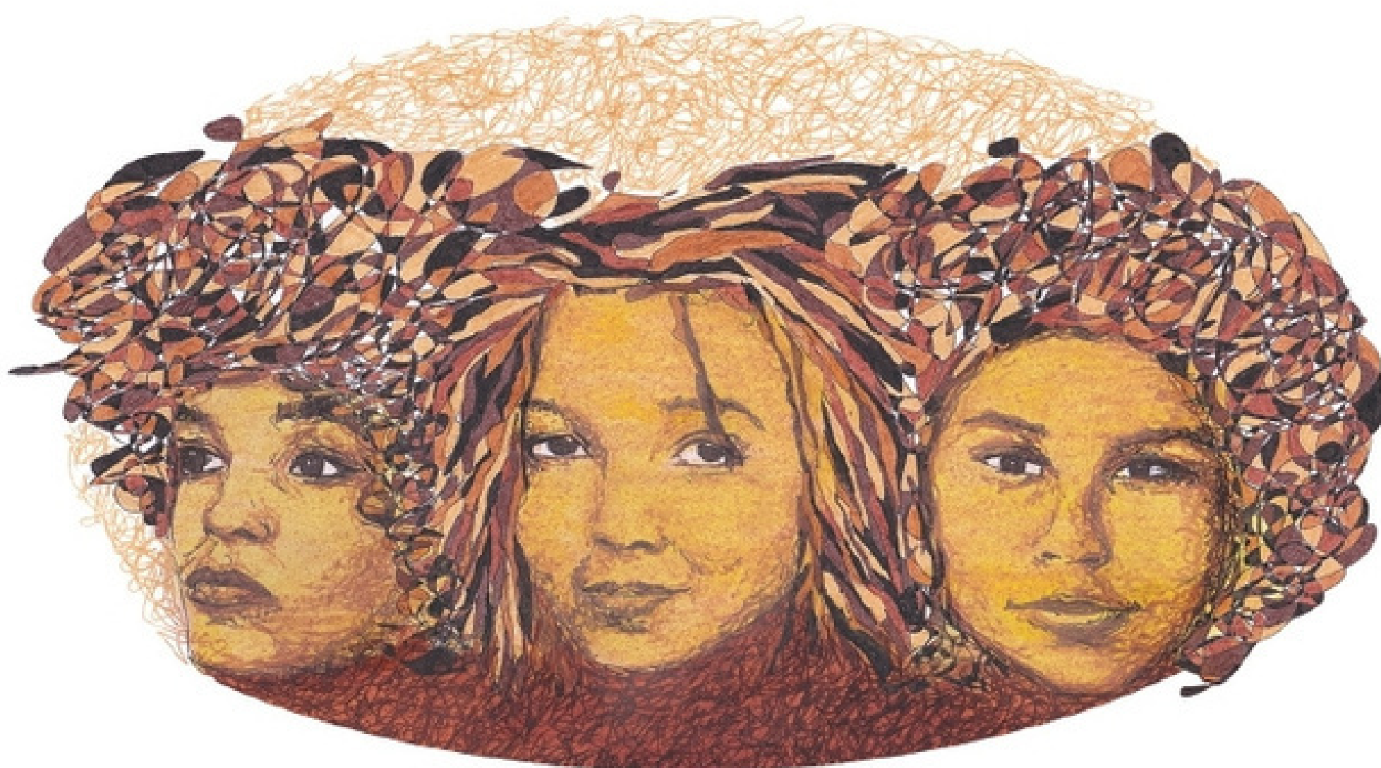
Illustrazione di Wissal Houbabi

In questo breve video , la rapper e artista Wissal Houbabi ci parla della parola Intersezionalità. Cosa significa e perché serve?