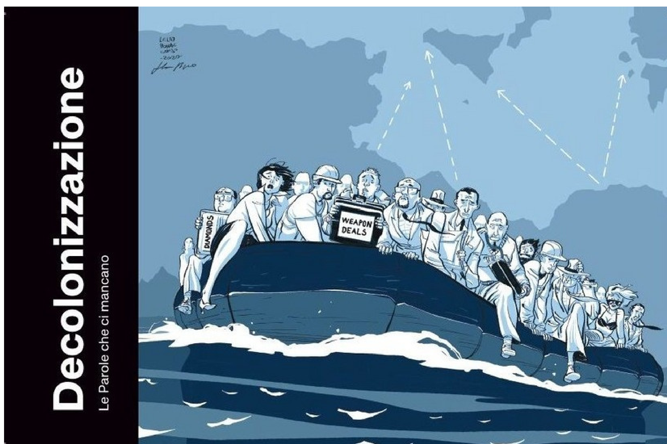
Illustrazione di Marco Rizzo e Leilo Bonaccorso

Senza una “decolonizzazione” dello sguardo, lo sforzo antirazzista rischia di cadere in trappole che lo rendono vano.