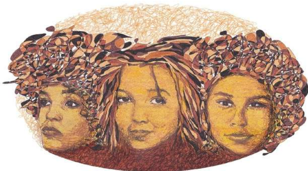
Illustrazione di Wissal Houbabi