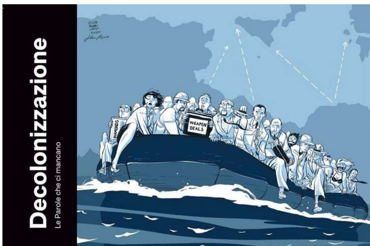
Illustrazione di Marco Rizzo e Leilo Bonaccorso

Senza una “decolonizzazione” dello sguardo, lo sforzo antirazzista rischia di cadere in trappole che lo rendono vano.