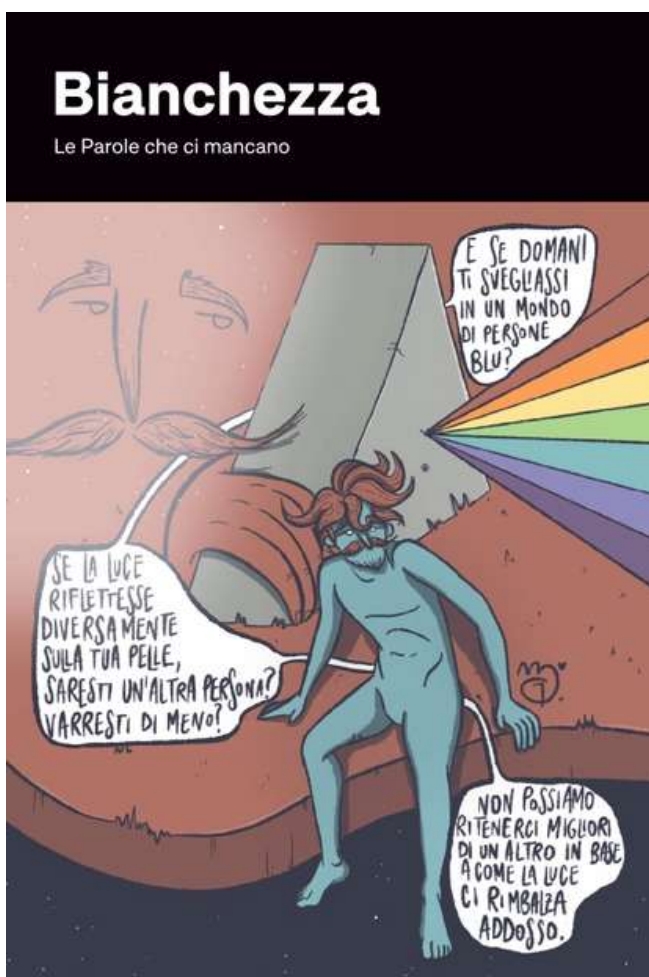
Illustrazione di Il Baffo - Giulio Mosca

(Tratto dalla campagna per la settimana dell'antirazzismo 2020: Le parole che ci mancano )