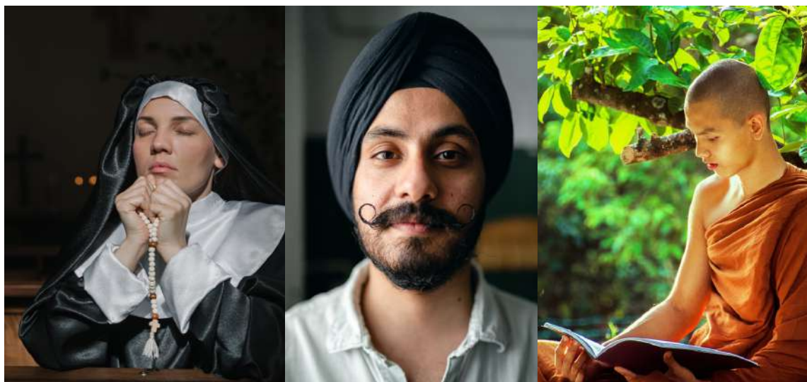
Da sinistra: una suora cattolica, un uomo Sikh, un monaco buddhista

I capelli hanno da sempre costituito un ruolo fondamentale nella presentazione dell'immagine di sé. I capelli racchiudono e veicolano diversi significati a seconda della cultura e della provenienza della persona che li porta, anche quando si decide di non mostrarli affatto, come accade in alcune religioni e culture.