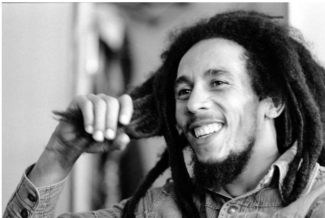
Bob Marley (1945 - 1981) indossa i dreadlocks. All'interno della religione Rastafari i dreadlocks simboleggiano un voto (nazireato) che i fedeli possono compiere. I dreadlocks sono dunque un segno religioso, non una semplice acconciatura.

Con gli anni 80 entrarono a far parte della discussione sulla bellezza al naturale anche i capelli acconciati in dreadlocks delle persone Nere, specialmente proseliti della religione Rastafari, fra cui il più noto Bob Marley. Quando durante un'intervista al cantante (reperibile nel documentario Marley ), un giornalista bianco gli chiese quale fosse il suo rapporto con i propri capelli, e perché non li tagliasse mai, la concisa risposta di Marley fu « hair is my identity »: i capelli sono la mia identità.