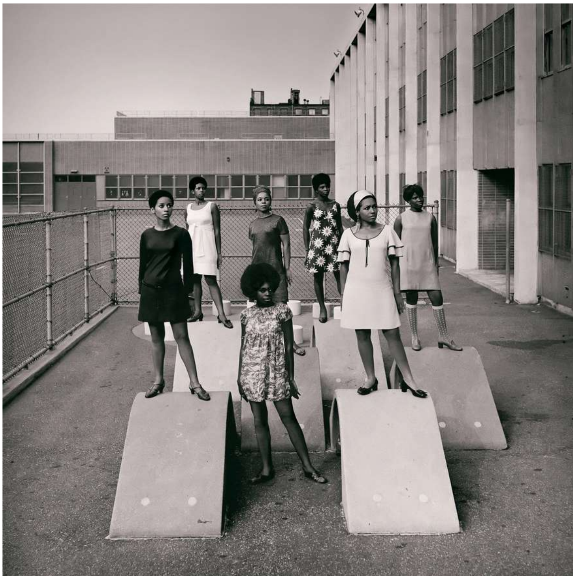
Servizio fotografico in una scuola per uno dei molti gruppi di modelle che avevano iniziato ad abbracciare le acconciature naturali, 1966

Un'altra persona attraverso cui la lotta per la liberazione dall'oppressione bianca passò anche attraverso i capelli è la celebre attivista Angela Davis. Davis portava (e porta tutt'oggi) orgogliosamente i capelli ricci Afro al naturale, diffondendo così il messaggio che divenne uno degli slogan delle Black Panther: "Black is beautiful".