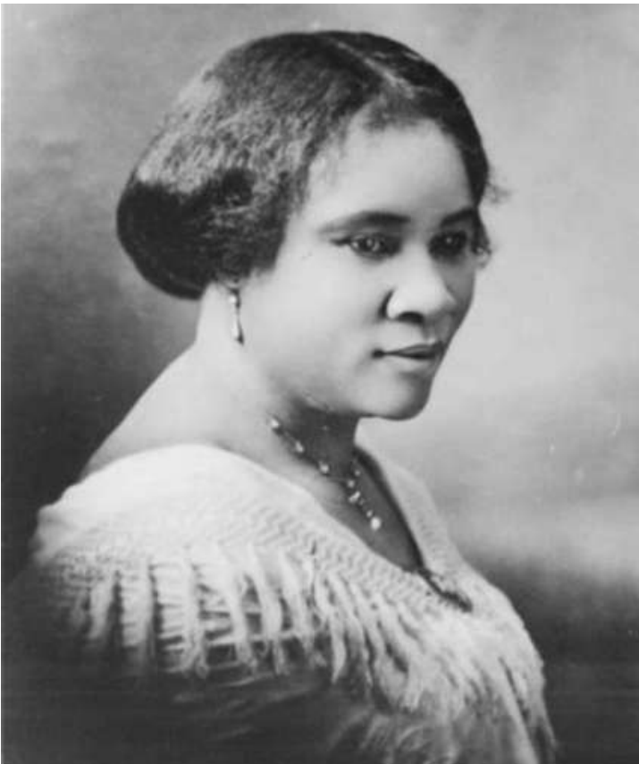
Madame C.J. Walker sulla sinistra, sulla destra manifesto pubblicitario dei prodotti di C.J. Walker

Fra le persone impegnate nella diffusione di prodotti che rendessero i capelli meno ricci divenne famosa Madame C. J. Walker. L'imprenditrice, grazie alla vendita dei suoi prodotti chimici liscianti che rendevano i capelli ricci afro simili a quelli delle persone bianche, divenne la prima donna milionaria Nera grazie alla vendita del suo prodotto.