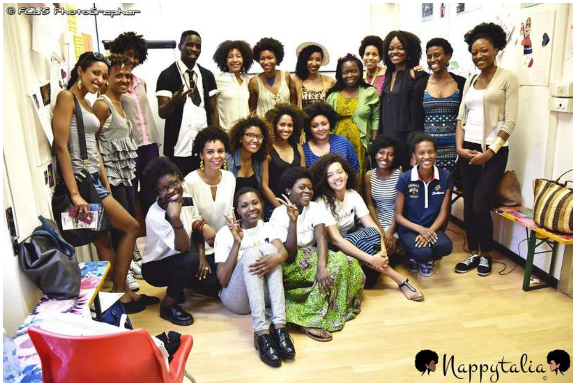
La community di Nappy Italia , Roma, 2015