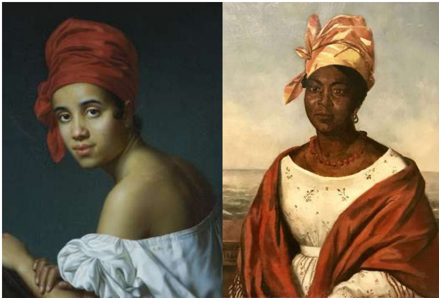
Due esempi di tignon in due dipinti: a sinistra, Creole in a Red Headdress di Jacques Guillaume Lucien Amans (ca. 1840); a destra, Woman in Tignon di Luis Nicolas Adolphe Rinck (1844).

Questo odio verso il corpo nero portò, negli Stati Uniti del 1786, alla promulgazione della legge Tignon, che impose alle donne in condizione di schiavitù di coprire i capelli con un foulard. Ma, contrariamente a quanto desiderato, la legge Tignon fu una sorta di liberazione per le donne nere, perché diede loro il modo di scampare allo sguardo sprezzante e bianco, e di imparare ad adornare il capo nei modi più svariati, rendendo il foulard un accessorio utilizzato anche come ornamento.