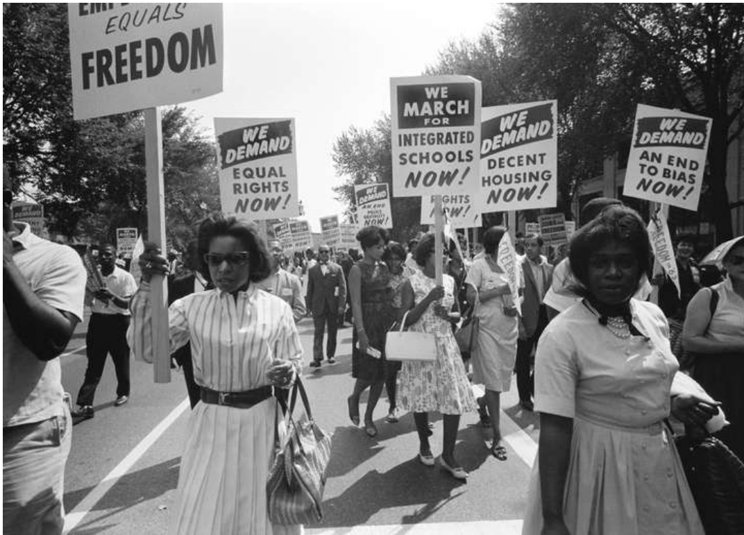
Immagine d'archivio di una marcia del Civil Rights Movement: 1960 circa

Noti personaggi del movimento per i diritti civili come Malcom X, dopo aver passato anni a stirare i capelli, cominciarono a portarli al naturale. Essi affermavano che la ragione che li portava a desiderare di avere i capelli lisci era in realtà l'odio verso sé stessi che gli era stato inculcato dalla cultura suprematista bianca. Questo odio si manifestava nella soppressione di una propria caratteristica fisica naturale.