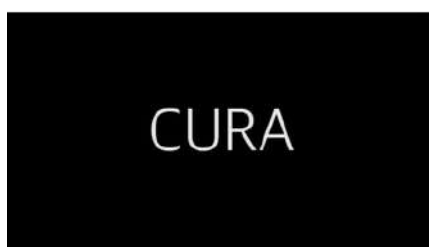
AMO I MIEI CAPELLI! - Cura e Lotte

In Crescita si parla dell'amore, dell'odio e dell'incertezza che caratterizzano l'esperienza delle persone afrodiscendenti con i loro capelli e della mancanza di rappresentazione del riccio afro nei prodotti culturali e nella vita di tutti i giorni.