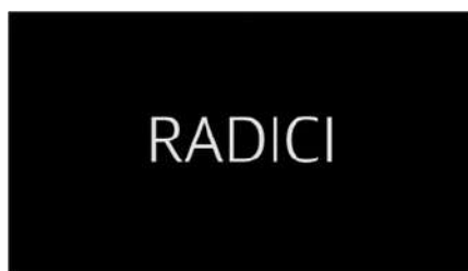
AMO I MIEI CAPELLI! - Radici

In Radici viene discusso il rapporto con i propri ricci afro, il significato di portare questi capelli da bambine - influenzate dallo standard di bellezza occidentale del capello liscio - e del taglio come simbolo di rinascita e di ricostruzione della propria identità.