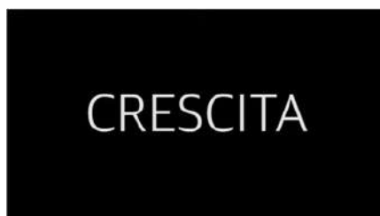
AMO I MIEI CAPELLI! - Crescita

In Radici viene discusso il rapporto con i propri ricci afro, il significato di portare questi capelli da bambine - influenzate dallo standard di bellezza occidentale del capello liscio - e del taglio come simbolo di rinascita e di ricostruzione della propria identità.