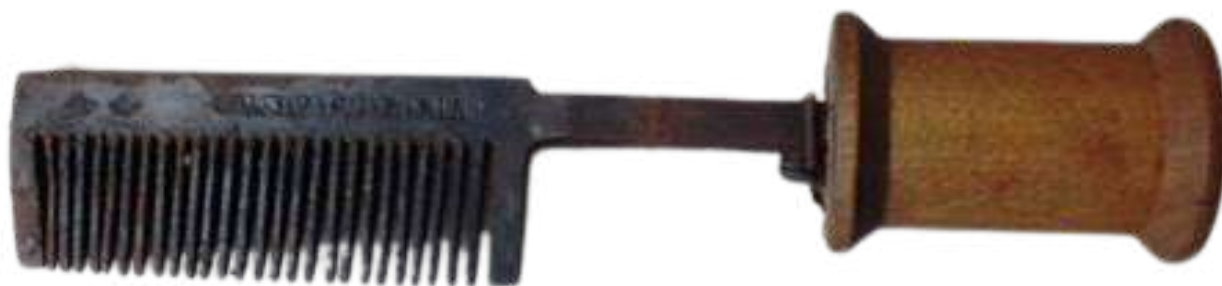
Un "iron hot comb", il pettine scaldato sul fuoco che si utilizzava per lisciare i capelli

In tale contesto, mossi dal desiderio di far assomigliare i propri capelli quanto più possibile a quelli degli schiavisti bianchi, tra le persone nere cominciarono a diffondersi diversi strumenti, tecniche e prodotti per raggiungere questo scopo, come il pettine scaldato sul fuoco, oppure l’utilizzo di agenti chimici utilizzati per la pulizia per renderli meno ricci, spesso a scapito della salute propria e del capello.