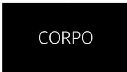
AMO I MIEI CAPELLI! - Corpo, Privilegio e Modelli

In Cura e Lotte viene esplorato il recente cambio di rotta iniziato dal movimento Nappy , che dà valore alla cura costante di cui ha bisogno questo tipo di capello, e del significato di emancipazione, resistenza e ribellione che il riccio afro porta con sé.